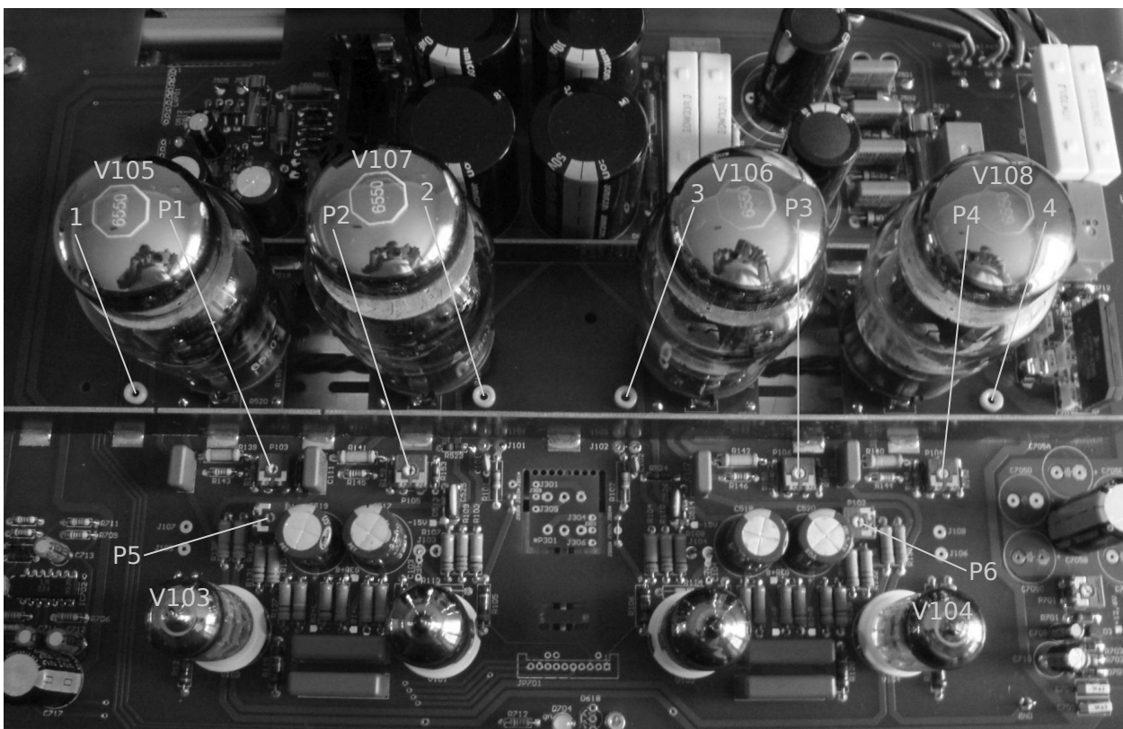
Teil-Innenansicht PeGaSuS 50/50

Zur Messung wird ein klirrarmer Sinusgenerator (THD=0,001% oder besser) und eine Klirrfaktormessbrücke mit einer Auflösung von 0,01% oder besser benötigt. Eingangssignal 1kHz anlegen und Pegel für ca. 1 Watt Leistung einstellen. Am Ausgang (mit Last abgeschlossen) Klirrfaktor messen und mit P5 für den rechten Kanal und mit P6 für den linken Kanal auf Minimum abgleichen. Typischerweise erreicht man so einen Klirrfaktor von 0,01%...0,05%. Dieser Abgleich ist normalerweise nur nach Austausch der Treiberöhren (V103 & 104) nötig.